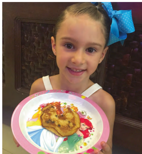
Listo el hotcakes de Chocolate