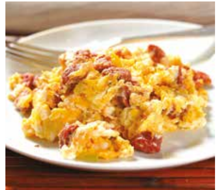
Listos los huevos con jamón