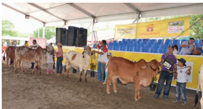
Participantes disfrutando del concurso Mostrador Infantil y Juvenil en la Feria de Puerto Boyacá 2015